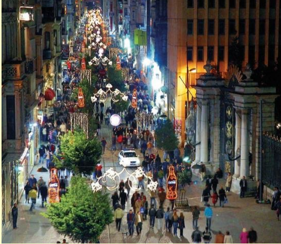
ISTIKLAL CADDESİ ISTIKLAL AVENUE